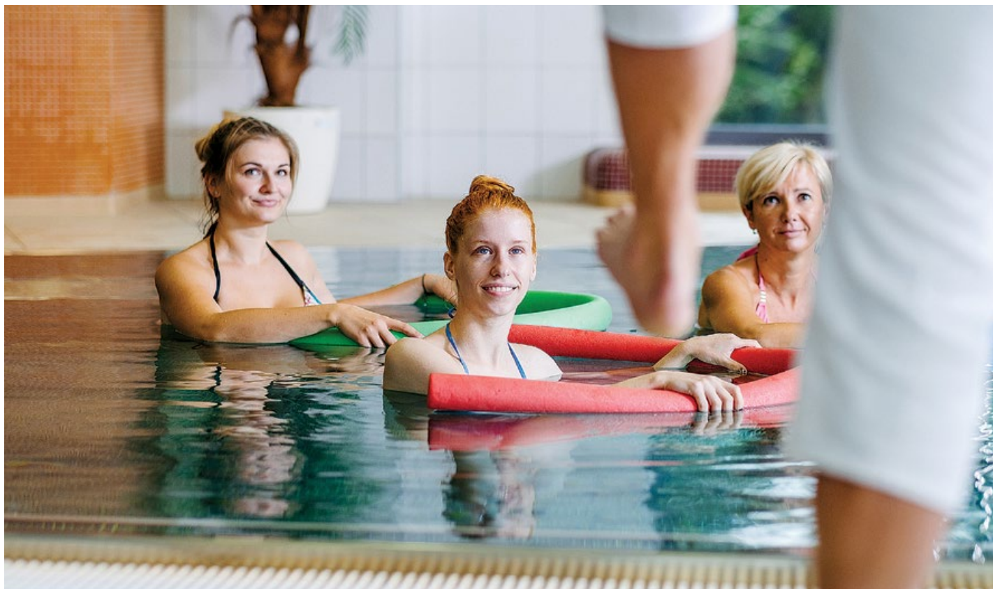
Skupinové cvičení v bazénu může být pro pacienty s RS vhodný typ pohybové léčby. Rehabilitační program je sestaven individuálně a stanovuje ho lékař při přijetí pacienta.