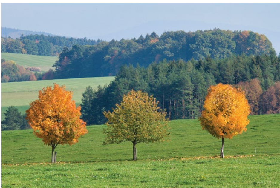
Také tato fotografie se objeví na listopadové výstavě Eduarda Paška.

Fotografie Romana Polácha za- stupuje jednoho z autorů první vý- stavy, která začíná v lednu příštího