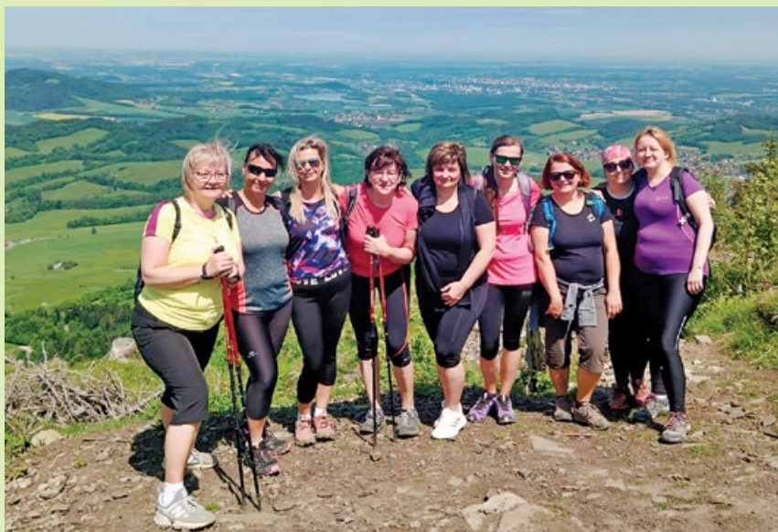
Společné výšlapy do hor jsou v kolektivu Léčebného domu Dr. May oblíbené. Snímek je z vrcholu Velkého Javorníku.

Odlišujeme se velikostí, máme menší počet pacientů, a proto naše oddělení působí domáctějším dojmem. Orientace v budově je snazší a to některým pacientům vyhovuje. Naše oddělení má také jako jediné na starosti zajištění chodu a služeb na ambulanci rehabilitačního centra, která je v Apartmánovém domě Lara. V roce 2016 byl Léčebný dům Dr. May nově otevřen po rekonstrukci, pokoje i příslušenství jsou velice vkusné a prakticky vybavené. Jsem si jistá, že vyhovují požadavkům a potřebám pacientů. Občas si jen postesknu po balkonech. Další výhodou tohoto léčebného domu je, že se nachází uprostřed areálu rehabilitačního centra. Restaurace U Sestřiček je v sousední budově, pár kroků přes náměstí je obchod a kavárna a blízko je to také do parku. ■