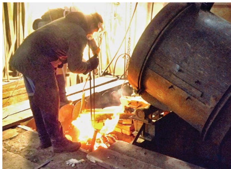
Dolní dva snímky zachycují odlévání čtyř zvonů v dubnu a v květnu 2013. Podobných unikátních záběrů obsahuje video o nových zvonech pro Čeladnou celou řadu. Když povážíte, že zvony se pořízují na stovky let, stojí za to si na toto video v TV Ondřejka počkat.