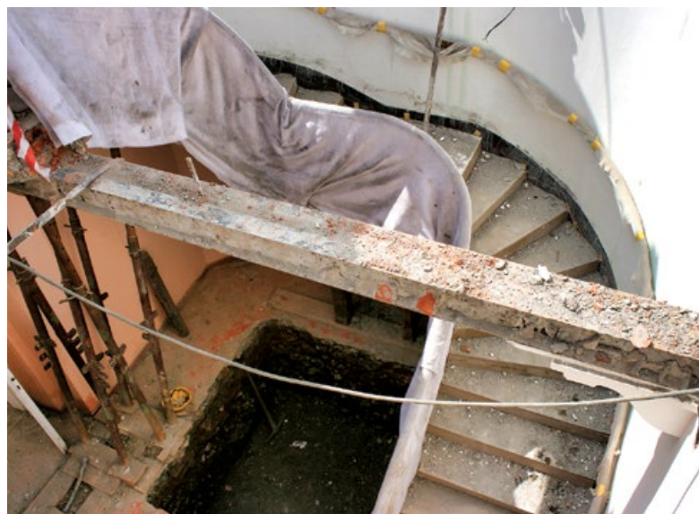
Uprostřed vlevo: Rekonstrukce LD Dr. May v letech 2015–2016 musela být mnohem rozsáhlejší, než se plánovalo. V pozadí je vidět budova Apartmánového domu Lara. Vpravo je snímek původního schodiště, které se podařilo zachránit a slouží v budově dodnes.