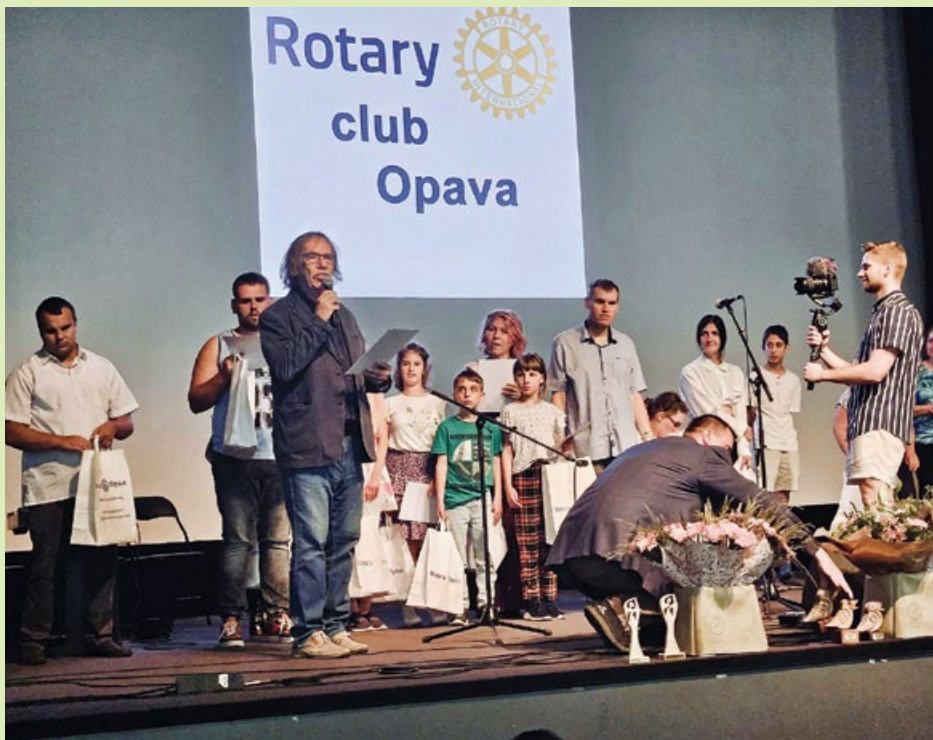
Začarovaná písnička je pěvecká soutěž pro handicapované, kterou opavští rotariáni pořádali letos již poněkolkáté. Tentokrát v porotě zasedl Jarek Nohavica.

a schopnosti ve prospěch druhých, a to jak v rámci vlastní obce, tak v mezinárodním měřítku. Na základě etických principů a hodnot, jako je přátelství, integrita, diverzita, služba a vůdcovství, tak naplňují své ušlechtilé poslání – dělat svět lepším.“