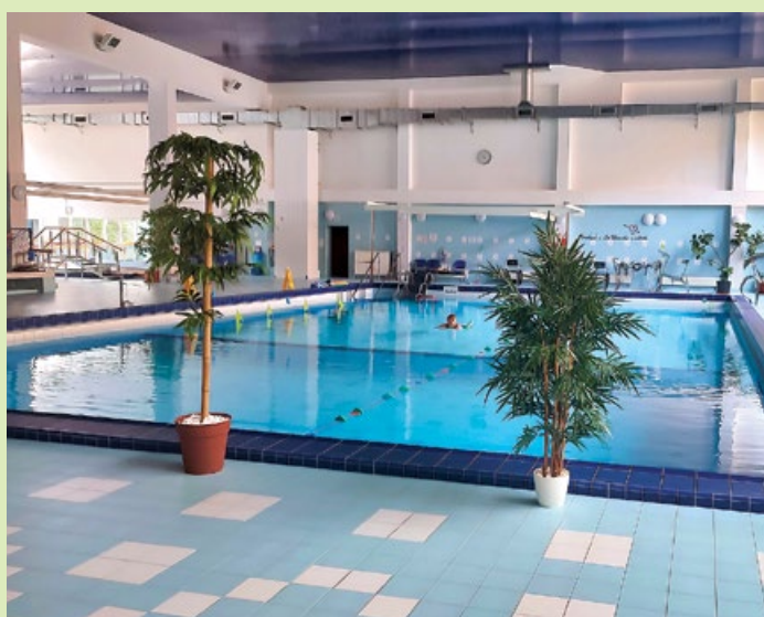
V Rehabilitačním ústavu Hrabyně jsme navštívili také tělocvičnu a rehabilitační prostory včetně bazénu.

lůžkové části. Celková kapacita centra je 217 pacientů. Prohlídku doprovázel výklad vedoucích pracovníků a byl i prostor na dotazy našich zaměstnanců. Prohlédli jsme si bazén, nejrůznější dílny a nakonec jsme zavítali i na spinální rehabilitační jednotku. Na závěr jsme poděkovali za milé přijetí a pozvali jsme zaměstnance RÚ Hrabyně naopak k nám.