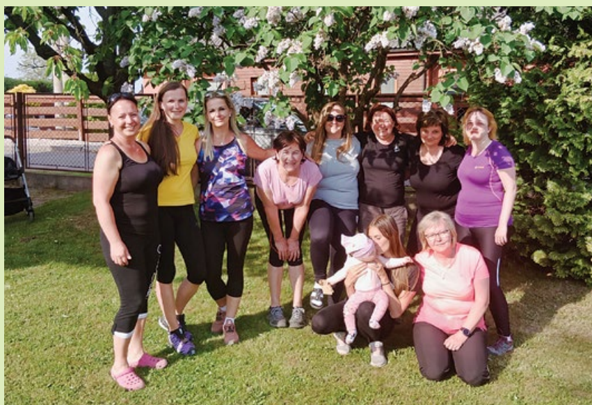
Cestou dolů z Velkého Javorníku se ještě stihly zastavit u kolegyně.