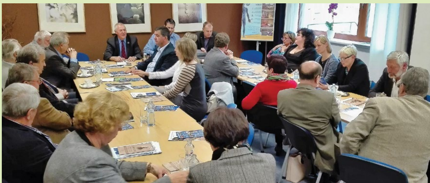
Členové Rotary klubu Opava přijeli v hojném počtu na exkurzi do rehabilitačního centra v roce 2016.

Na první otázku bude vhodnější odpovědět přímo citací z našich webových stránek www.Rotary2240.org : „Rotary International je nejstarší mezinárodní klubovou organizací na světě. Vznikla v roce 1905 v americkém Chicagu a v současné době působí ve více než 200 zemích. V 35 000 Rotary klubech sdružuje 1,2 milionu členů (rotariánů) – žen i mužů, vůdčích osobností a profesionálů z různých oborů. Tuto celosvětovou síť spojuje myšlenka vyjádřená mottem Service Above Self (angl., do češtiny nejčastěji překládáno jako Služba nad vlastní zájmy). Rotariáni dobrovolně věnují svůj čas