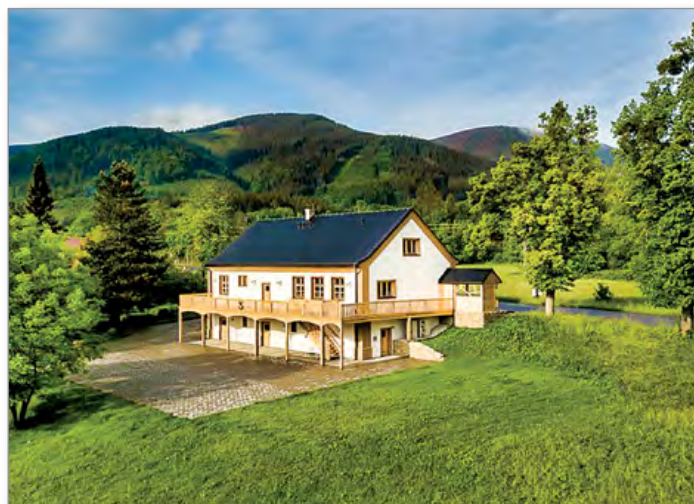
Cenu hejtmána v soutěži Stavba Moravskoslezského kraje získal Památník Josefa Kaluse v Čeladné