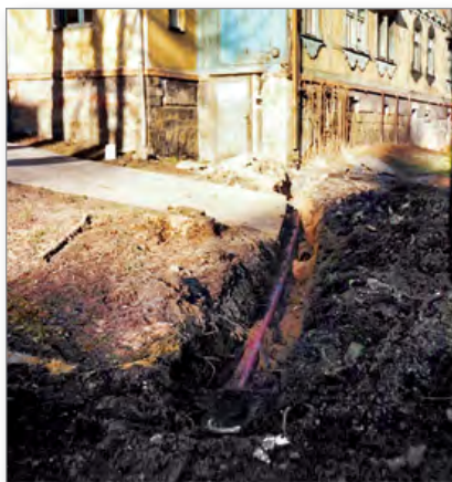
Takto vypadala v roce 1997 Ondřejka a její okolí...