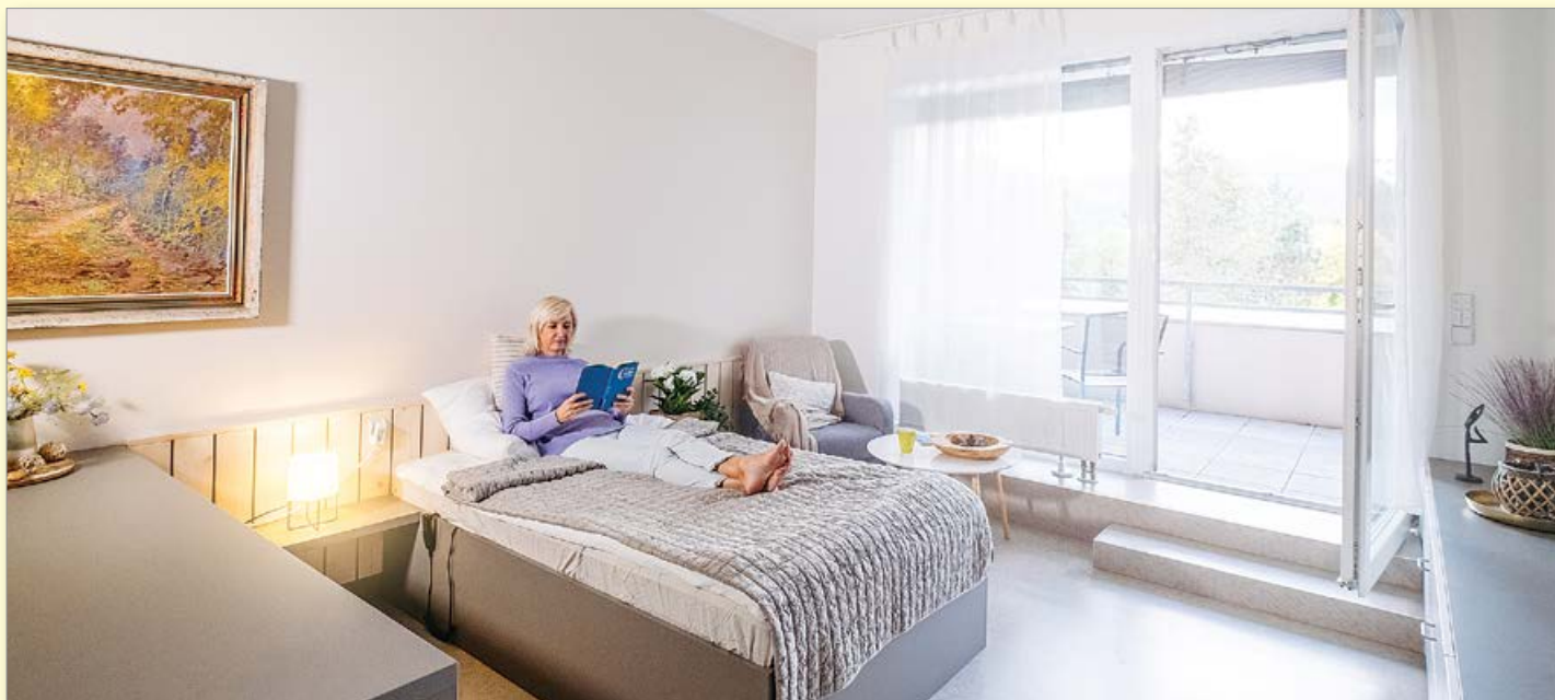
Vlevo: Nové prostory rehabilitačního komplexu v Léčebném domě Dr. Storch I. Nahoře: Prostorné apartmány v LD Storch II. Rehabilitace i tento léčebný dům jsou v provozu od roku 2020. Při akreditaci jsme se měli čím chlubit.