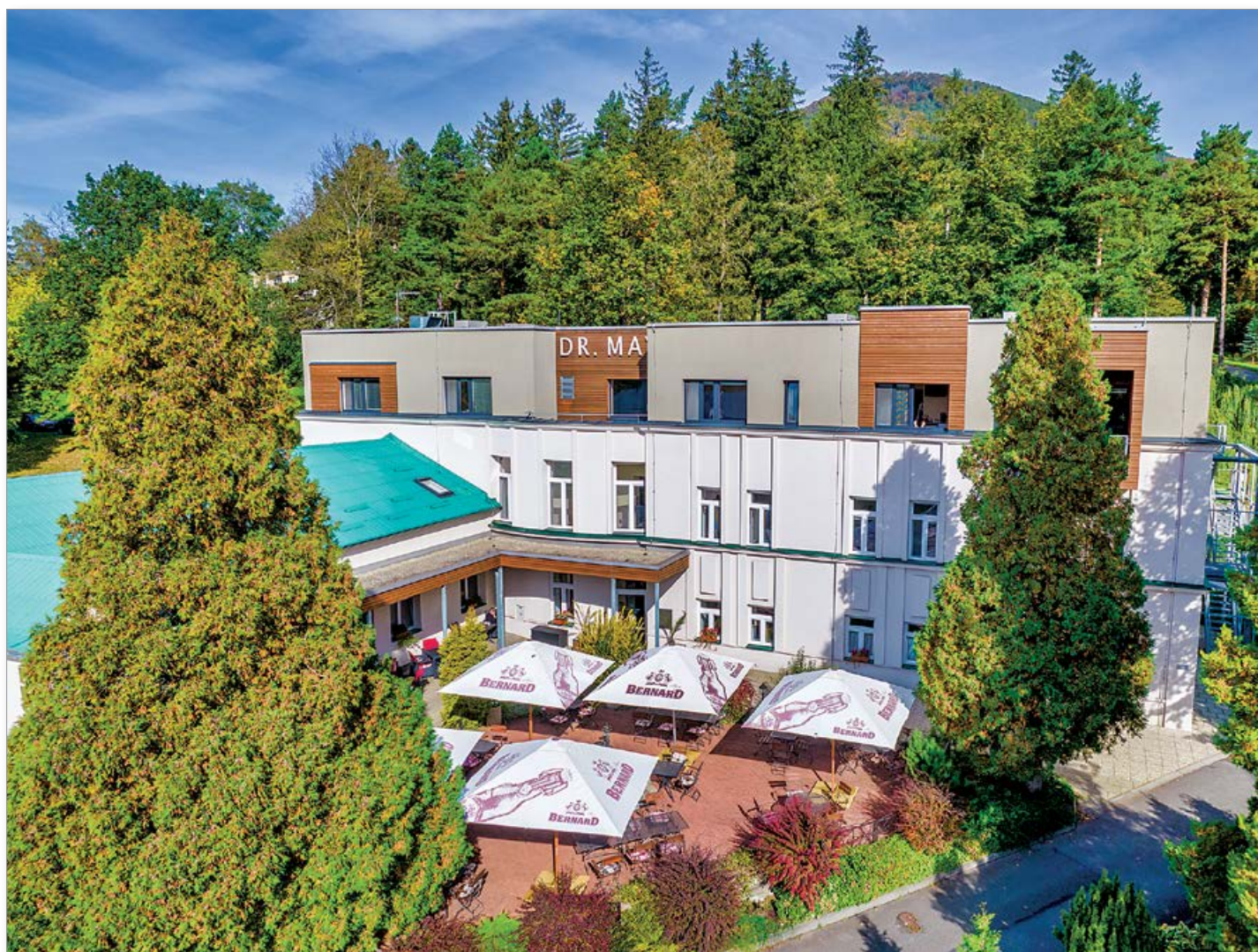
Léčebný dům Dr. May nese jméno lékaře, který v těchto místech založil v roce 1902 Lázně Skalka. V pozadí se rýsuje Skalka (964 m n. m.), nejvyšší vrchol masivu Ondřejníku.

novým hrdinům v podstatě velice podobné. Podobají se tak trochu oné bláznivé desetidenní cestě tří přátel po řece Temži, s tím rozdílem, že nemají společného foxteriéra Montmorencyho, ale každý z nich měl nebo má své psy. A také s tím rozdílem, že jejich cesta trvá již více než dvacet let a stále ještě (zaplať bůh) neskončila.