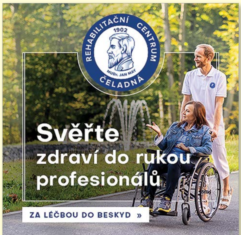
Nahoře: Grafických návrhů bannerů na facebook máme několik. Tento se zatím zobrazuje uživatelům nejčastěji.

Březen 2022: Nejviditelnější je od začátku tohoto měsíce naše stálá aktivita na facebooku. Pracovníci Betteru začali „úřadovat“ a zveřejňují zde sponzorované příspěvky. To znamená, že příspěvek obsahuje finanční dotaci a nastavují se u něj zároveň podmínky, komu se má zobrazit (například věk uživatelů, vzdálenost od Čeladné v kilometrech apod.) Tomu předcházelo schválení několika navržených verzí „hero sdělení“. To je silné emoční sdělení v několika slovech, které představuje klíčové benefity (výhody) našich služeb. Za tímto účelem grafici Betteru vytvořili bannery pro remarketing zobrazované uživatelům, kteří již v minulosti náš web navštívili. Bannery mají velký ohlas, příspěvky pod nimi jsou četné a většinou pocházejí od našich bývalých nebo současných pacientů. Ti se v komentářích pochvalně vyjadřují k léčbě, ubytování či k prostředí.