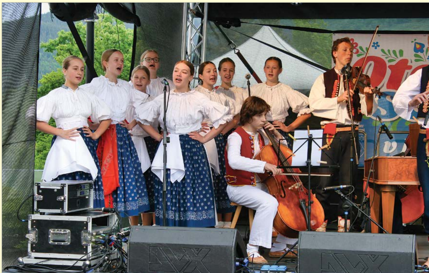
Slavnostní Otevření sezóny 2022 bylo poděkováním zaměstnancům za práci v uplynulých třech letech a za úspěšnou akreditaci. Součástí kulturního programu bylo také vystoupení Dětského folklórního souboru Valášek z Kozlovic. Více na dalších stranách.

Opět jsme prokázali, že naše rehabilitační centrum má ve všech ohledech vysokou úroveň. A toho si velmi vážím, děkuji Vám za to a gratuluji Vám.