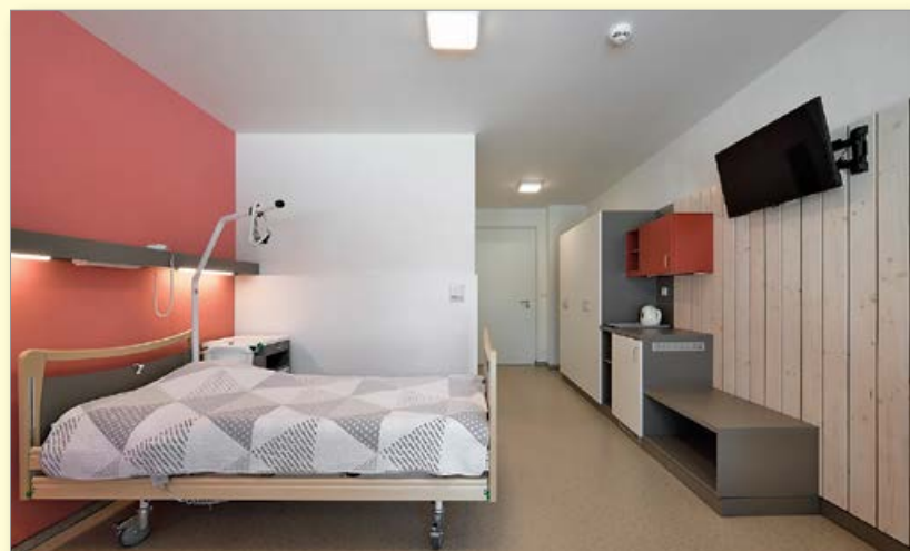
Nahoře: Nový Léčebný dům Dr. Storch II. Uprostřed a dole: Vybavení jednolůžkového pokoje.

Jsm rádi, že navzdory loňským ztíženým podmínkám se nám podařilo stavbu úspěšně dokončit a věříme, že bude dobře a dlouho sloužit ke spokojenosti našich pacientů. (bo)