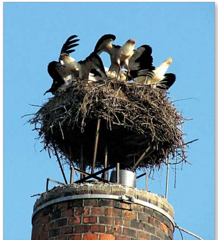
Zleva doprava a shora dolů: Řeka čaruje Cesta do Čeladné Voňavý příslib léta Čapí krmení (21. 8. 2018 v 11.43)