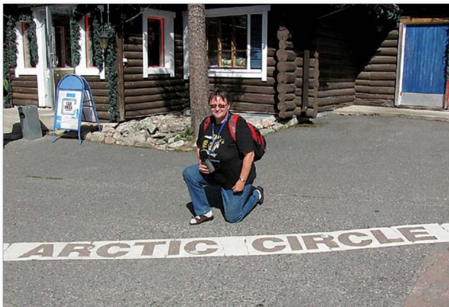
Ve Finsku za severním polárním kruhem.

1992, ten byl organizačně hodně náročný. Skončila jsem v roce 2010, kdy už jsem začala špatně chodit.