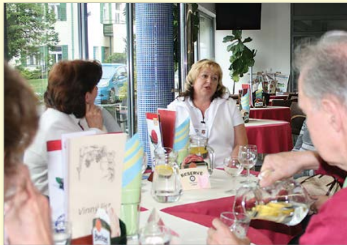
▲ 2014: K pracovním povinnostem hlavní sestry patří také zajištění exkurzí studentů zdravotních škol nebo pracovníků v oblasti sociálních služeb. Zde na setkání se zaměstnanci Speciálního pedagogického centra pro tělesně postižené z Frýdku-Místku.